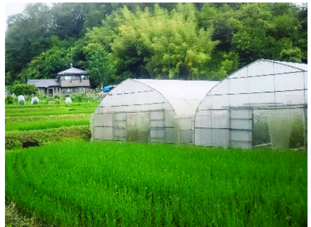
山あいの農地を利用してハウス栽培で トマト他新鮮な野菜を出荷しております。