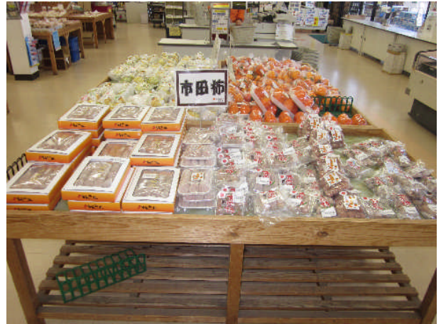
最終工程を経て、製品となった市田柿は、JA等に出荷され、直売所等で販売されます。