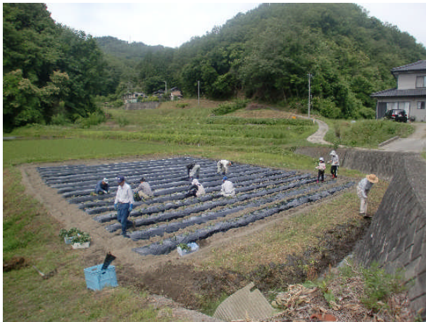
中山間地を守る仲間達です。 共同作業でさつまいもを作ってます。