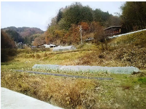
ここが私たちの山あいの、のどかな集落風景です。