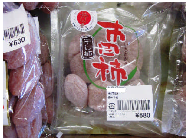
市田柿は、地理的表示(GI)保護制度により登録されています。 (平成28年7月12日登録・登録No.13)