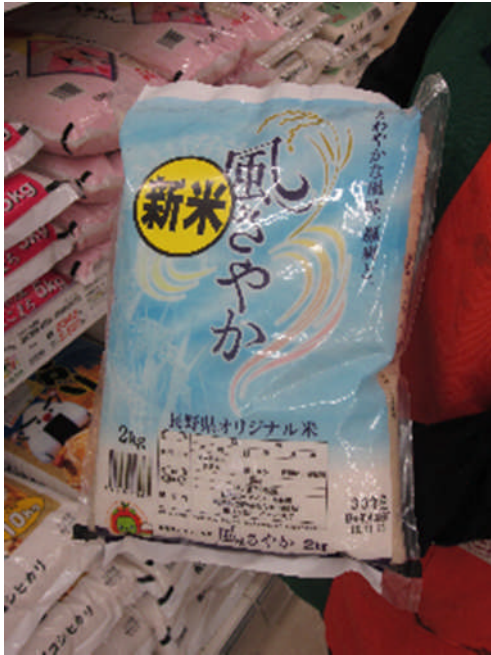
長野県オリジナル米「風さやか等」を栽培。農家が愛情を込め、三穂地区の自然豊かな環境で育ちました。JA等に出荷しています。