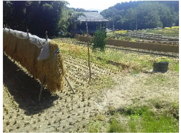
昔ながらのはざかけ米でおいしいお米を JAを通じて出荷しております。