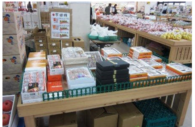
直売所の風景。 高品質な干し柿は特に好評をいただいています。