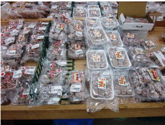
地域特産品の市田柿は、生産農家により様々なパッケージ化され、お買い求めやすく販売されています。