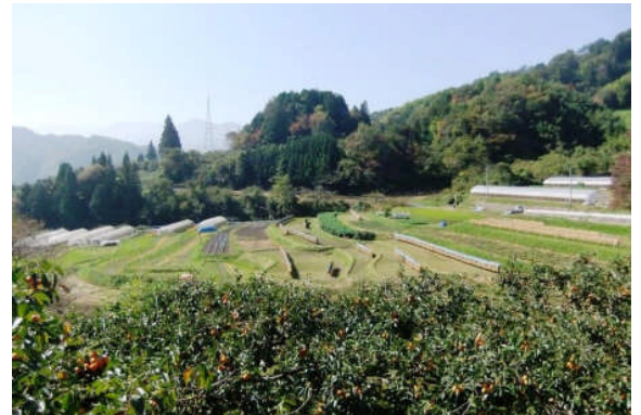
集落の風景。市田柿園から水田地帯を臨む