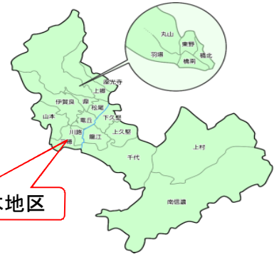
三穂南伊豆木地区

◎お米や市田柿のほか、ブランド米の「風さやか」を使用した名産「鯖寿司」(県無形民俗文化財)も好評販売中です。