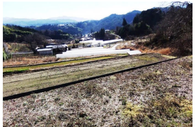
棚田よりアスパラ・花卉栽培のハウスを臨む 超急傾斜地でも農地を有効利用し栽培を行っています。