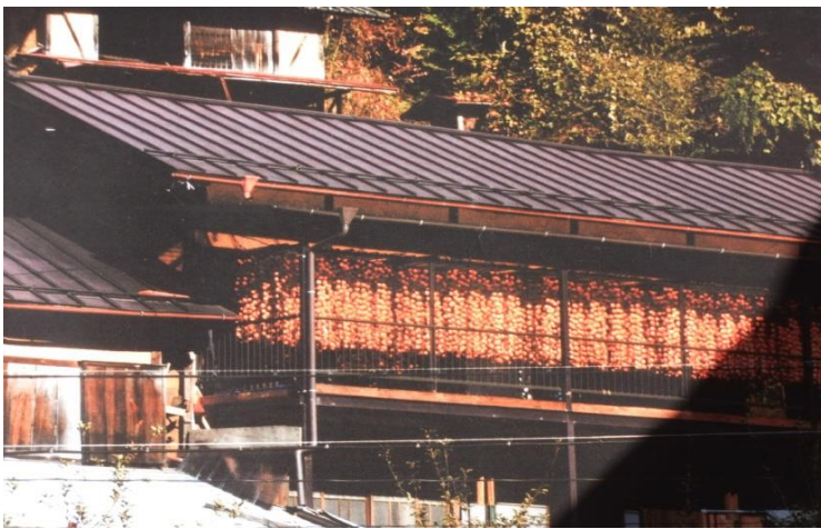
11月頃には農家のハウスは柿すだれで一杯です。