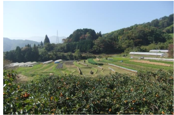
集落の風景。市田柿園から水田地帯を臨む