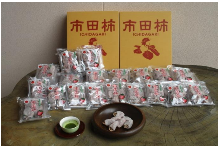
地域特産品の市田柿はこのような荷姿で、全国に出荷されます。