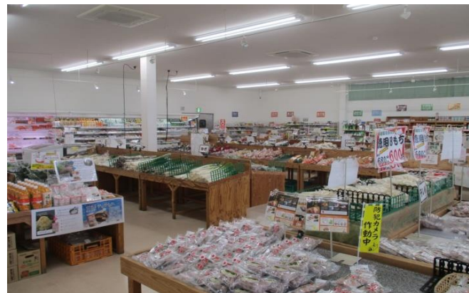
直売所の風景。 高品質な干し柿は特に好評をいただいています。