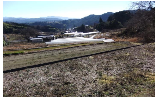
棚田よりアスパラ・花卉栽培のハウスを臨む 超急傾斜地でも農地を有効利用し栽培を行っています。