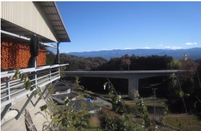
柿すだれ。晩秋になると、農家のハウスに柿すだれが見られます。