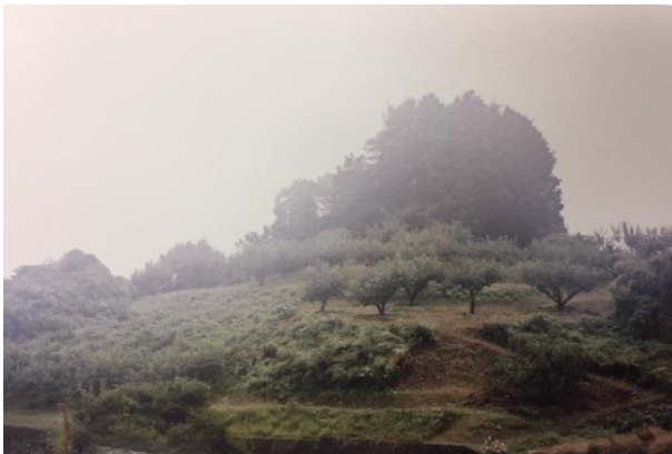
超急傾斜農地。多少困難な作業もありますが、高品質な柿を栽培しています。