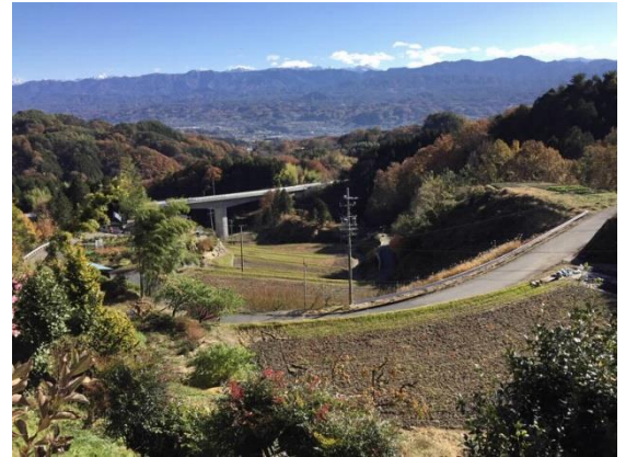
集落の風景。昔ながらの景観が多く残ります。