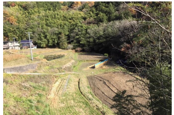
米。はざかけ米の技術が今も伝承されています。