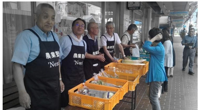
直売所。毎週木曜日に開催し、固定客も増えています。