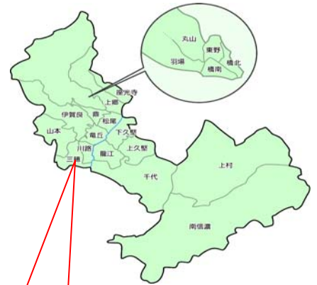
阿坂鍋田関坂協定

正月の前後に生産される干柿は地区の最主力農産物で、農家の半数以上が取り組んでいます。