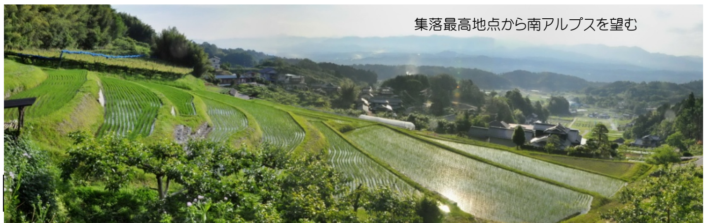
集落最高地点から南アルプスを望む