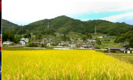
水晶山の麓が私たちの集落