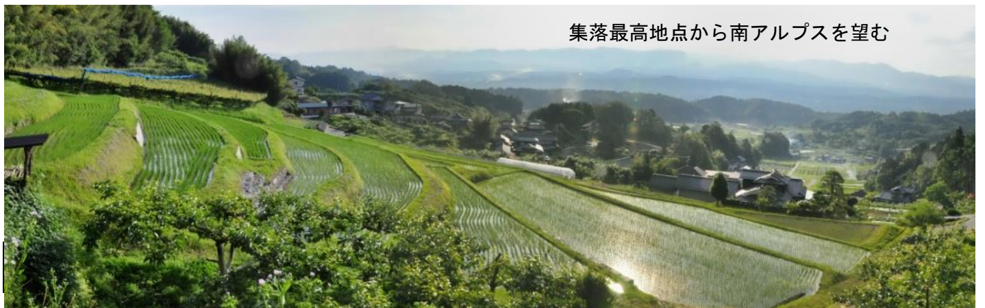
集落最高地点から南アルプスを望む