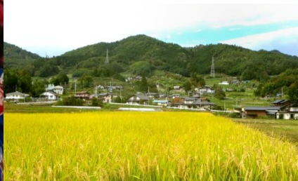
水晶山の麓が私たちの集